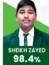
SHEIKH ZAYED 98.4%